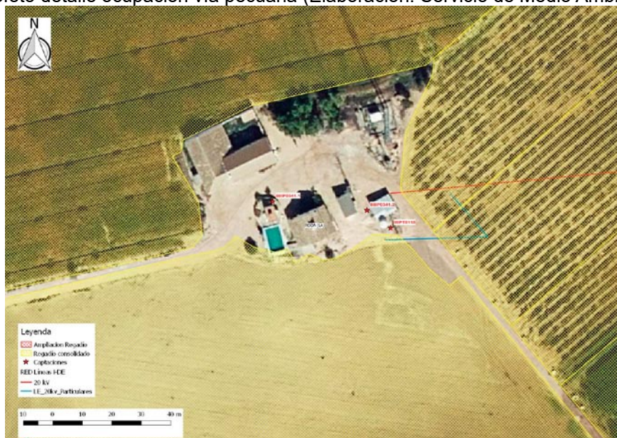
Ortofoto detalle captaciones (Elaboración: Servicio de Medio Ambiente)