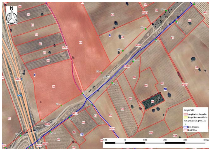
Ortofoto detalle ocupación vía pecuaria (Elaboración: Servicio de Medio Ambiente)