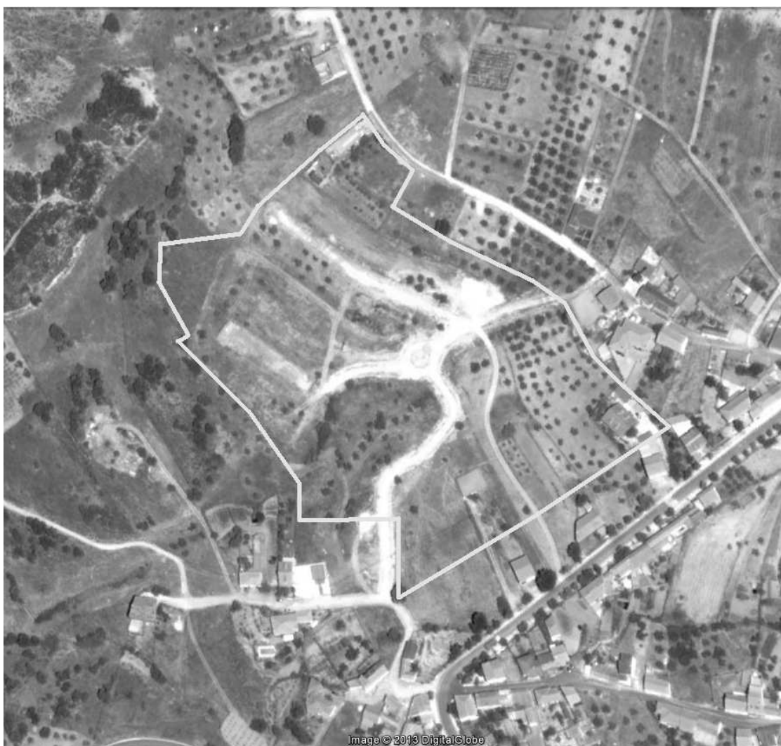
Imagen de Julio de 2011